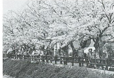
多くの市民でにぎわう桜土手