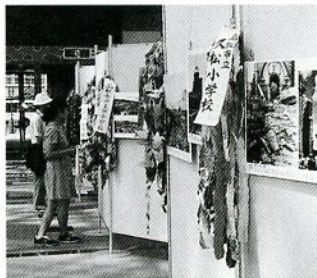
パネル写真展のようす

八月六日は広島市、九日は長崎市に原爆が投下された日です。平和を祈って正午から一分間の黙とうをささげましょう。