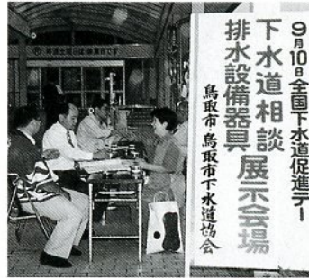
下水道相談のようす

9月10日(金)下水道促進デー 下水道相談 展示会場 鳥取市鳥取市下水道協会 催します。 ●相談所の開設と 水洗用器具展示 とき 9月4日(土)・ 5日(日) 午前9時～午後 4時 ところ 賀露地区公民館