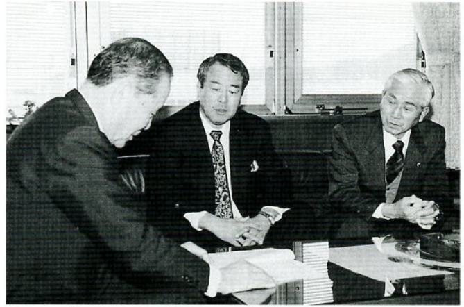
市政懇話会としての意見書を市長に提出

鳥取市では、市政に対して幅広く市民のみなさんのご意見をうかがう場として、「鳥取市政懇話会」を設置しています。このたび、その委員の一部を公募します。 「明るくにぎわいのあるまち鳥取」をみんなで作るため、あなたも参加してみませんか。多数ご応募ください。