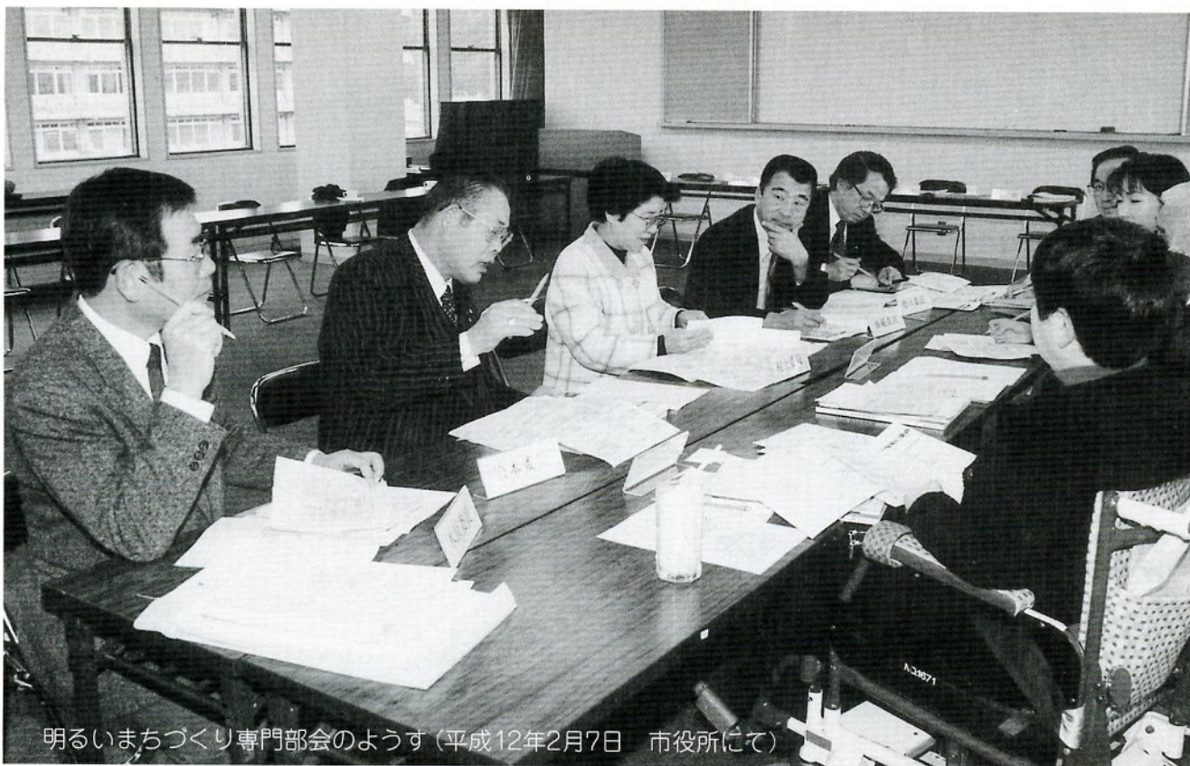
明るいまちづくり専門部会のような様子（平成12年2月7日 市役所にて）