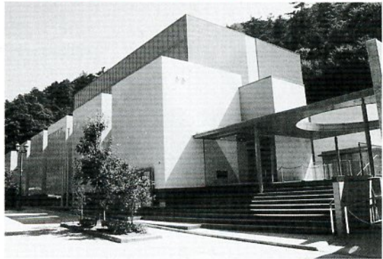
いよいよ7月にオープンする鳥取市歴史博物館(やまびこ館)

よび作文(題名)「やまびこ館の案内係が担当のもの」/400字詰め原稿用紙2枚以内)を持参または郵送してください。