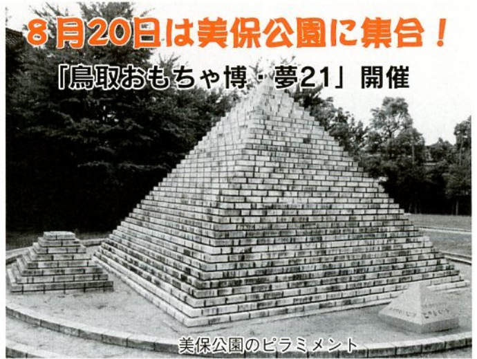
美保公園のピラミメント

「89鳥取・世界おもちゃ博」で子どもたちのメッセージカードを納めたタイムカプセルの開封式を開催します。 このカプセルは、当時の小学3年生が、成人を迎えた未来の自分にあてたメッセージカードを納めたもので、博覧会に来た子どもたちが会場の美保公園に造りあげたピラミメント型のモニユメント「ピラミメント」に埋め込まれています。メッセージカードは二十一世紀最初となる来年の成人式で本人に渡されることになっています。 また、開封式当日は、新た