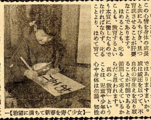
【希望に満ちて新春を寿ぐ少女】

不良化の発生件数は、一〇二件で、前年同期の二〇二件に比して、一〇〇%の減少を示しております。この減少は、前年同期の二〇〇%の増加であり、罪種別に見ますと、二、〇〇二件の減少を示しております。