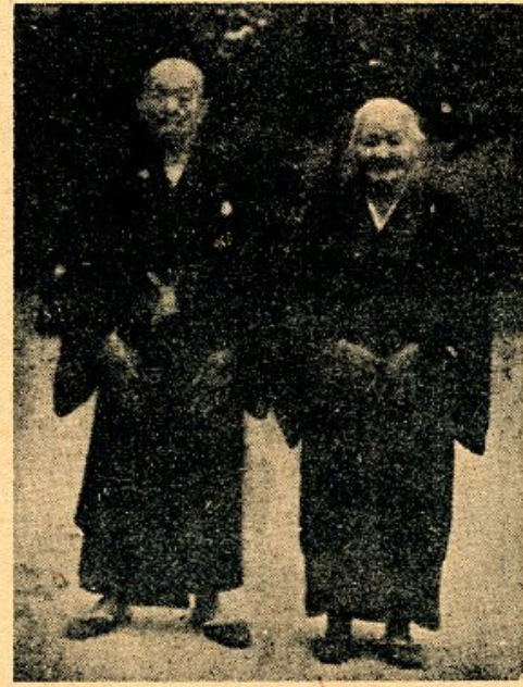
(写真)尾崎市長(左)と尾崎御夫婦(右)の合影