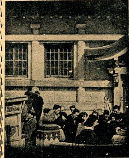
これは街頭博の一場面です。好奇心から金のある山に入ると大変です。近頃は、この仲間の仲間に入ると大変です。近頃は、この仲間の仲間に入ると大変です。