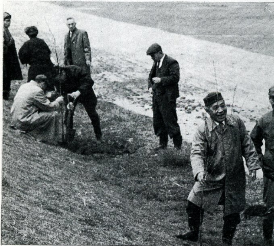
サクラの苗木を植える豊実老人クラブの方がた