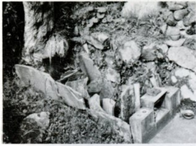
葦岡長者の墓と伝えられる古墳(吉岡温泉町で)

吉岡温泉町。湖山池の北西にある町である。京都の東山粟田口というところに、比叡山延暦寺の三門跡の一つ青蓮院という寺院があ