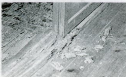
(シロアリの駆除はおまかせ下さい)