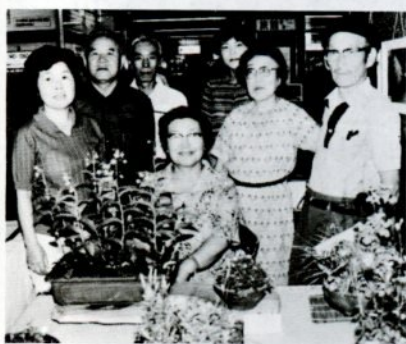
鳥取駅構内での初の展示会 (6月)

作る楽しみ、見る楽しみ、見せる楽しみの三つの楽しみがあります。「山野草を介して人と人とのふれあいを和を」「心の交流を深め合い、視野の広い豊かな人間関係を」を