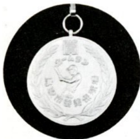
ホームラン打者に贈られる記念メダル