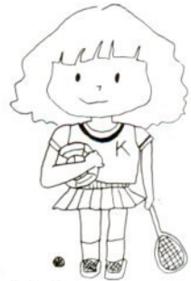
イラスト 安本美智代(21)＝吉成

あなたは「鳥取市勤労青少年ホーム」という施設があるのをご存じですか? 吉成の市民体育館横に位置しており、青少年が自由に使用できる若者のための施設。これが、勤労青少年ホームなのです。四十七年に設立された勤労青少年ホーム(以下ホームと略します)は、こととして十周年を迎え、今、新しい人たちのエネルギーを待ち望んでいる次第なのです。