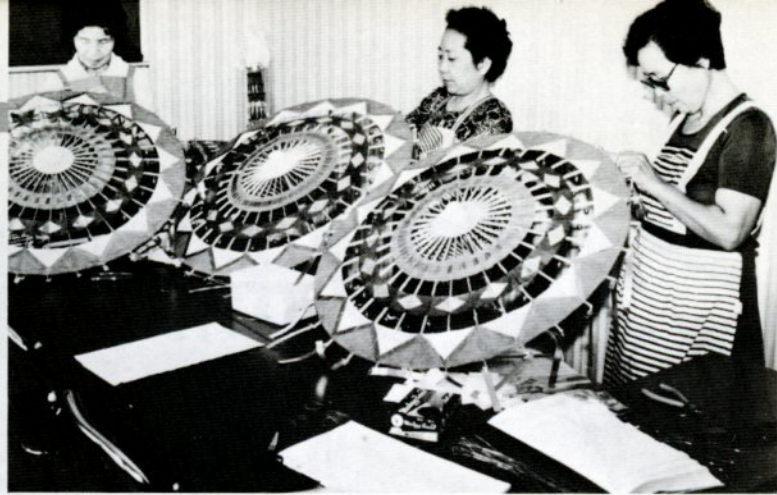
しゃんしゃん祭の傘の飾り付けをするシルバー人材センター会員