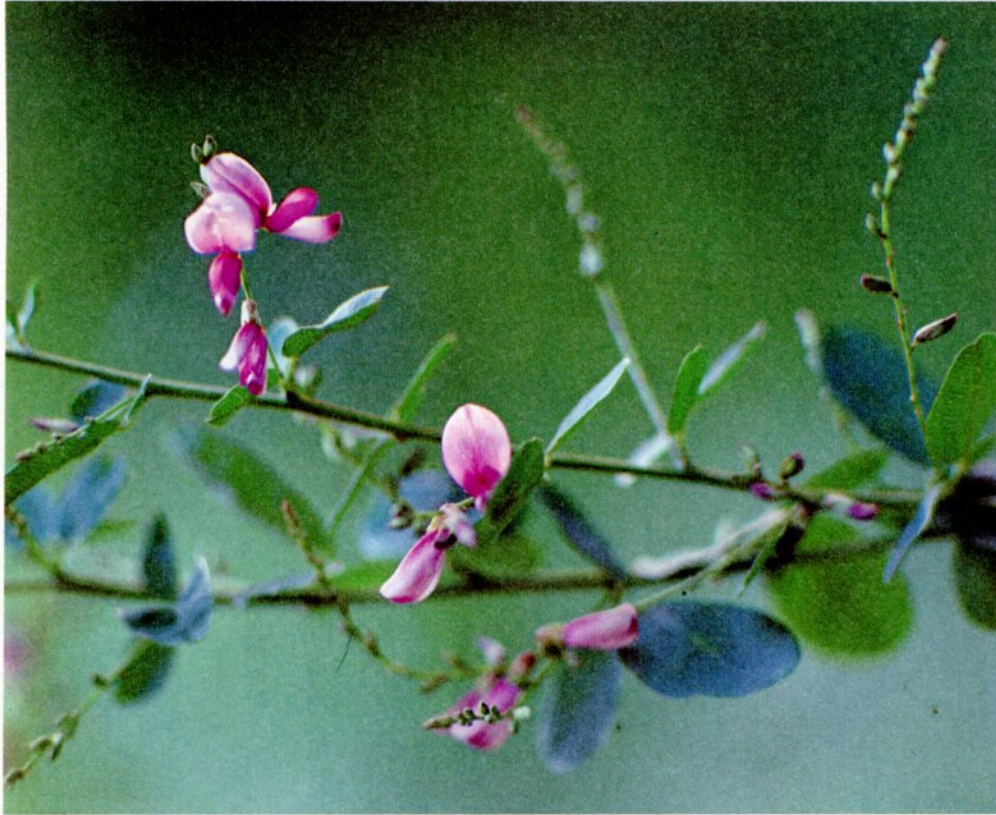
撮影・森田 貴介(寺町) 梶野公園で