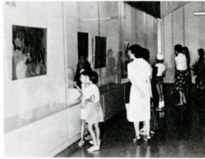
25点の作品が展示された姫路市民美術作品展（文化センター展示ホールで）

姫路市との姉妹都市締結十周年記念行事として、七月末から姫路市民美術作品展と中学生交歓キャンプを相次いで実施しました。 美術作品展は、七月三十一日から八月四日まで、市文化センター展示ホールで開催、七月下旬に開かれた第三十七回姫路市美術展の入賞作品二十五点を展示しました。会場に訪れた市民は、日本画、洋画、写真など、姫路市民の洗練された作品に見入っていました。また同会場では、この四月に市訪中団が訪れた中国・揚州市の児童作品二十四点も特別展示されました。 一方、鳥取、姫路両市の中学生交歓キャンプは八月五日と六日の二日間、浜坂の柳茶屋キャンプ場で開かれました。