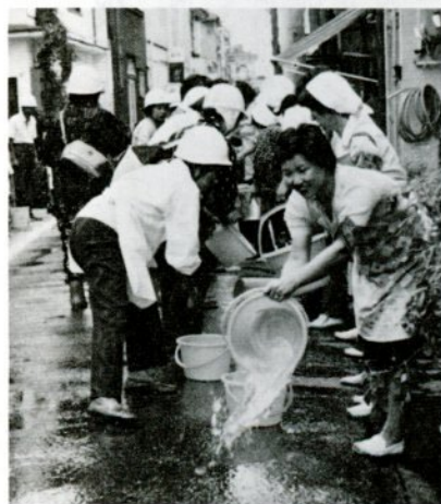
去年9月10日の防災訓練で初期消火訓練をする元町防災会の皆さん

「鳥取に地震は起こりませんか」と、私が地震学を専攻していると知ればよく聞かれる。残念ながら答えようがないのである。地震予知の科学は着々と進んでいて、日本の大動脈である東海地方には来たるべき地震の前兆現象をとらえるために種々の観測がなされている。そのデータは東京の気象庁に送られ、日夜、監視が続けられている。そして、異常な現象があれば、高名な学者からなる地震判定会が即