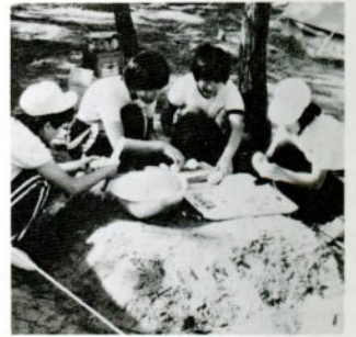
交歓キャンプで夕食を作る中学生たち（柳茶屋キャンプ場で）

この交歓キャンプは、両市が姉妹都市を結んだ四十七年から毎年、招待先を交互に替えて実施しているものでこととして十一回め。 参加生徒は両市から三年生の男女各二十五人の計百人。十三のグループに分かれた生徒たちは、テント設置、夕食作りに力を合わせていました。夕食後は、キャンプファイヤーを囲んでフォークダンスや歌を楽しみました。