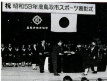
祝 昭和59年度鳥取市スポーツ表彰式

市スポーツ表彰で62人と28団体を表彰 59年度市スポーツ表彰式を2月23日、文化ホールで行いました。この市スポーツ表彰は、36年から市のスポーツ振興を図ろう、と毎年実施しているので、今年度の受章者は、体育功労章5人、優秀指導者賞1人、スポーツ章50人と24団体、スポーツ奨励賞が6人と4団体の合わせて62人、28団体で、過去最高の表彰となりました。