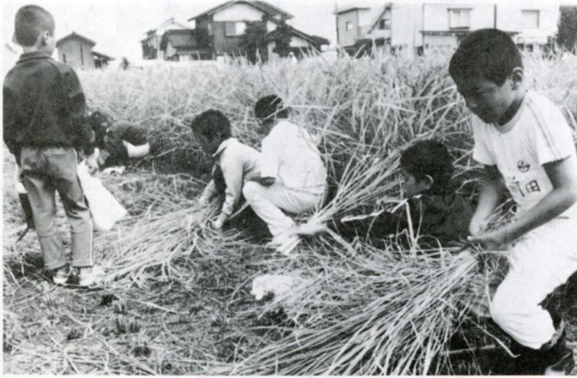
去年10月に行われた湖南小の稲刈り