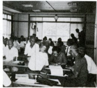
面影地区公民館での高齢者同和教育学習会

たな創意工夫と、組織の総力を挙げて取り組んだ実践活動を反省し、今後の面影地区同和教育推進協議会の目標を定めたいと考えます。学校同和教育と社会同和教育の緊密な連携を図るため、第十一回邑法ブロック同和教育研修大会に参加した七十余名全員が、桜ヶ丘中の人権学習を参観し、「親と子の同和問題の学習を深め、差別のない明るい地域づくりの輪を広げよう」を主題に、実りのある研究、協議を進めました。また、地域内の会社、工場、事業所などの代表者を対象に企業同和教育研修会を開き、「同和問題の解決が職業選択と就業保障にあること、職場の人権学習を普及、充実することが企業の繁栄につながる」となどの理解を深めることができました。「教育は人なり」社会的信望があり、同和問題に深い関心と理解を持ち、すべての人々の人権を尊重し、部落差別をなくすための熱意と行動力を持つ指導者を養成、確保することが急務です。地域の