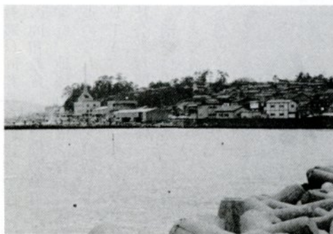
鳥ヶ島から賀露神社方面を望む

「賀露」と呼ばれていたよいうであるので、その地名に由来する伝説であろう。しかし、「かる」という地名の語源は今一つはつきりしない。『和名抄』