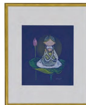
版画 協賛賞 「Hold」Kayo