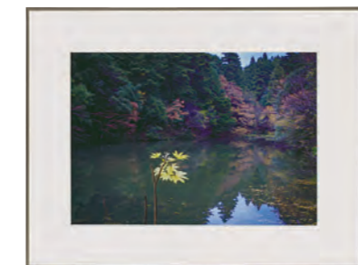
写真 協賛賞 「湖畔の静寂」 下田 優