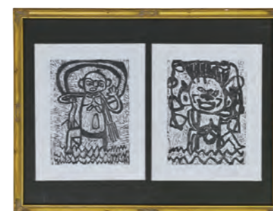
版画 市展賞 「風神・雷神」山村和弘