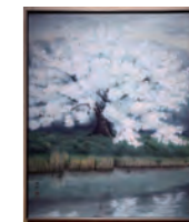
「海華」個人蔵 (鳥取市あおや郷土館寄託)