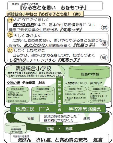
教育ビジョン案(委員会資料より抜粋)

その結果、教育ビジョン(気高らしさ)を色濃く出す場所を多目的ホール(地域交流ホール)とし、建築資材で木を多く使用することや、『継承・交流・創造の拠点』施設として、地域も活用しやすい配置・設備・機能とすることなどを施設設計に反映していただくこととしました。