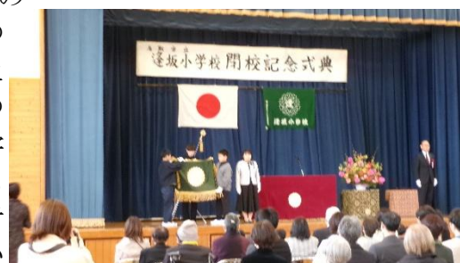
逢坂小学校閉校記念式典の様子

令和8年4月からの逢坂小学校の浜村小学校への編入に向けて、両小学校、逢坂地域、浜村地域の関係者にも、様々な事項の調整・確認をしていただきました。また、2月22日には逢坂小学校の閉校式典・閉校事業が開催されました。逢坂小学校や閉校事業実行委員会等の関係者のご尽力のもと、盛大に開催され、当日は約260名の来場者があり、それぞれが閉校する逢坂小学校への思いを馳せた一日となりました。