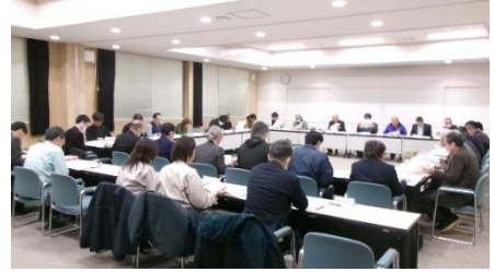
統合準備委員会の様子

今回も議題に対して各委員から様々な意見や質問がありました。委員会の資料や議事概要は、鳥取市公式ウェブサイトにて公開しておりますので、ぜひご確認ください。