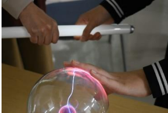
2日 こども科学館サイエンスショー