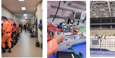
〈6月3日鳥取消防署・エネトピアアリーナ見学〉