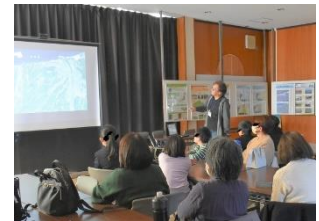
9日 湖山池情報プラザ見学