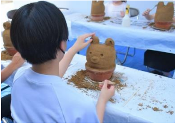
〈8月26日砂像制作体験〉