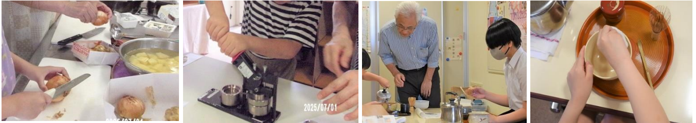
〈7月1日調理活動・缶バッジづくり〉