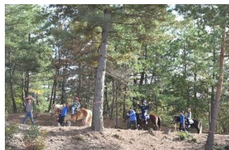
11日 こどもの国乗馬体験