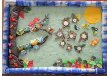
〈9月2日和紙折り紙共同制作〉