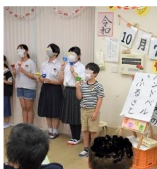
〈7日なないろデイサービスセンター訪問〉