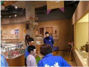
13日 わらへ館 からくりコーナー