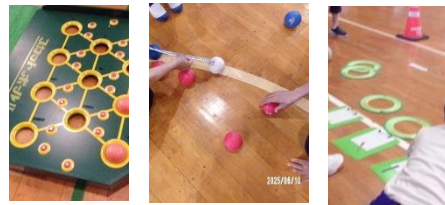
〈6月10日ニュースポーツ〉