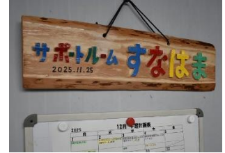
すなはま入口の看板