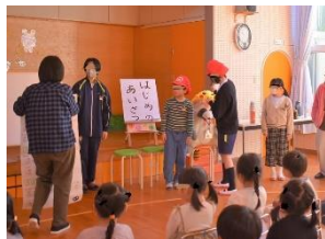
11日 福部保育園訪問交流