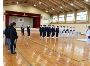
9日 県警察学校見学