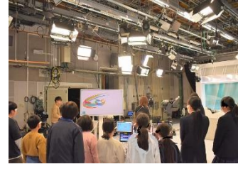
(2/17 NHK 見学)