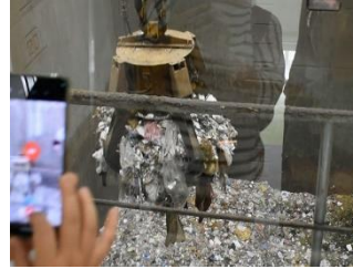
〈9月9日リンピアいなば・バードスタジアム見学〉