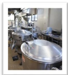
ガス釜 (汁や炒め物)