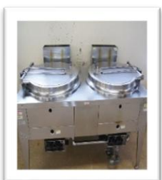
フライヤー (揚げ物)