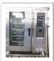
スチームオープン (蒸し物や焼き物)