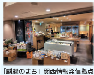
「麒麟のまち」関西情報発信拠点