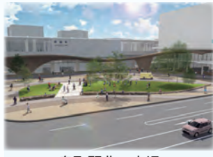
鳥取駅北口広場 デザインイメージ