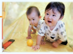
おもちゃのサブスク

【特集】一人ひとりが自分の力を発揮でき、支え合いながら ともに豊かに暮らせる鳥取市～オアシスとっとり～