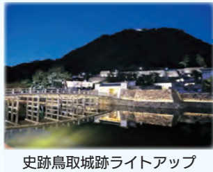
史跡鳥取城跡ライトアップ