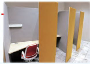
まちなかビジネス・コミュニティ拠点