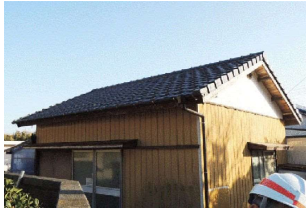
ガイドライン工法の瓦屋根（ほとんど被害なし）