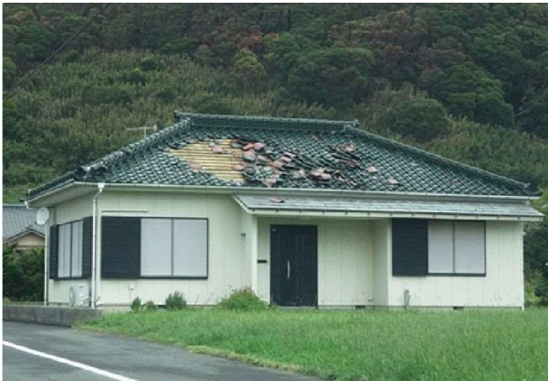
非ガイドライン工法の瓦屋根（瓦が脱落）

鳥取市は、国・県と協調し、屋根の耐風性能が十分でない住宅の屋根瓦が、強風時に周囲の建築物に被害を及ぼすことを未然に防止するために、屋根瓦の改修（屋根瓦耐風対策工事）を行う所有者に対して費用の一部を助成します。