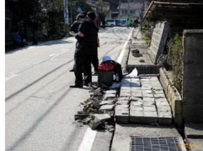
地震で倒壊したブロック塀