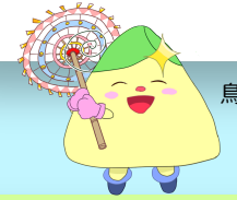
鳥取市男女共同参画センター マスコットキャラクター 「輝なんせさんかくん」

【基本理念】 だれもが性別にかかわらず個人として尊重され、自らの意思に基づき、その個性や能力を十分に発揮できる「男女共同参画都市・とっとり」の実現を目指します。 【計画期間】 令和8年度から令和12年度まで（5年間）