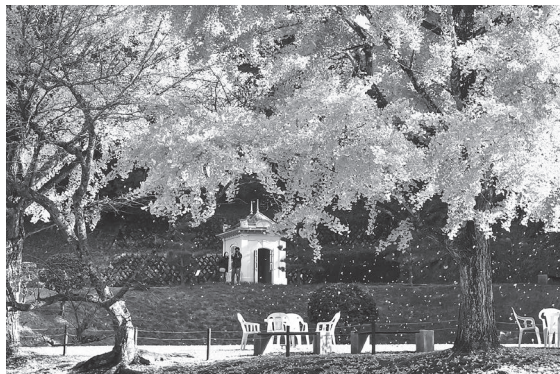
写真部門「イチョウの舞」