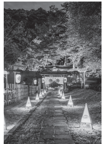
インスタ部門「一夜の灯し火」