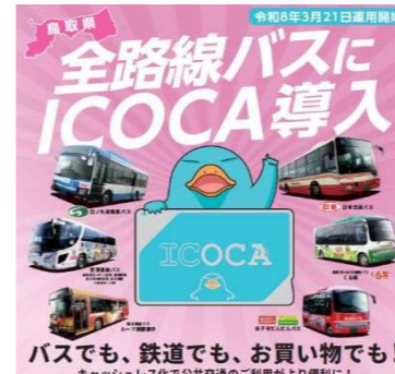
■路線バスへのICOCA導入