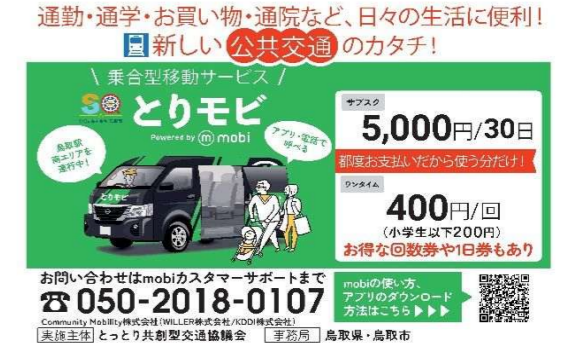
■とりモビ実証運行（AIオンデマンド乗合交通）