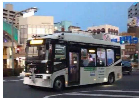
■自動運転の実証運行