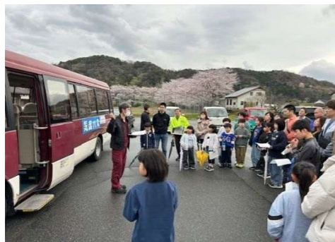
■気高・鹿野バスの運行見直し（気高町・鹿野町）