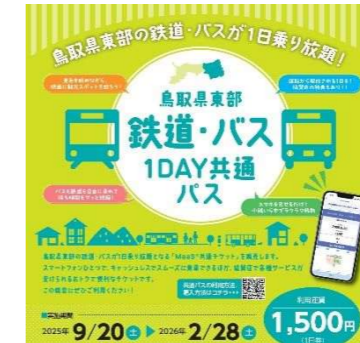
■鳥取県東部鉄道・バス共通パス販売