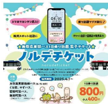
■ノルデチケット販売