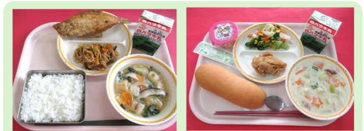
令和3年度給食イメージ