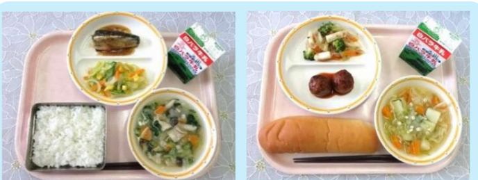
令和7年度給食イメージ

「物価高騰前の令和3年度と同様の給食の質を確保できる水準に戻す事」を基本的な考え方としており、「質を引き上げる」ものではなく、「本来あるべき水準を維持・回復するための設定」となります。