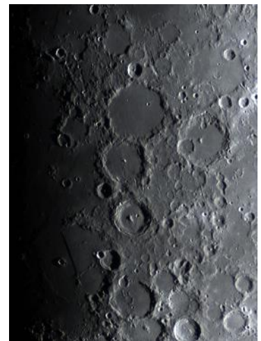
月の穴ぼこ「クレーター」