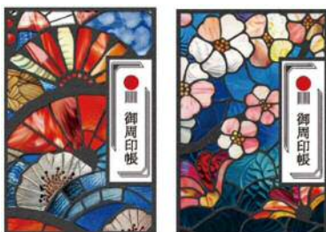
日本遺産御周印帳(2種類)