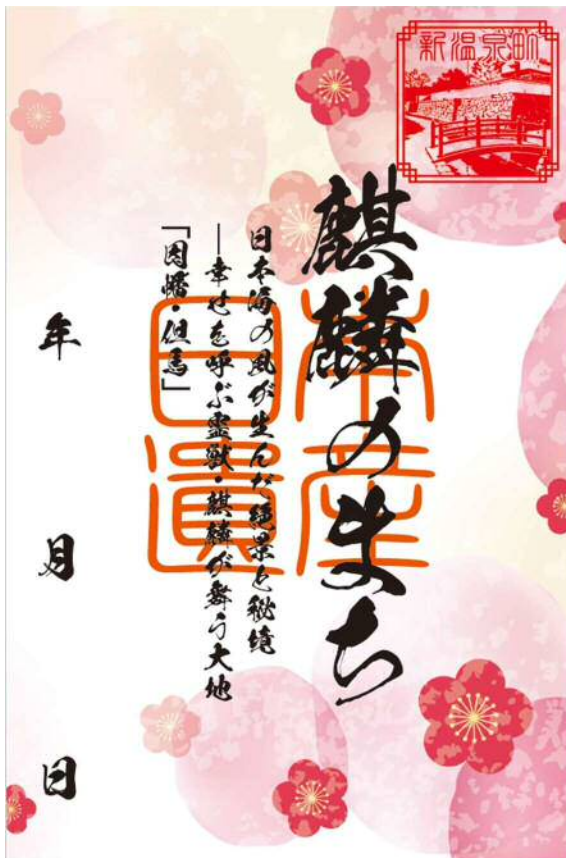
【新温泉町】新温泉町浜坂味原川地区