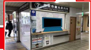
デジタルサイネージ設置イメージ