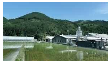
エーゼログループ本社(岡山県西粟倉村)

鳥取市で、自然資本産業誘致・振興事業を推進していくにあたり、調査・視察等の対応を考慮し、鳥取での事業所開設を決定したものの。