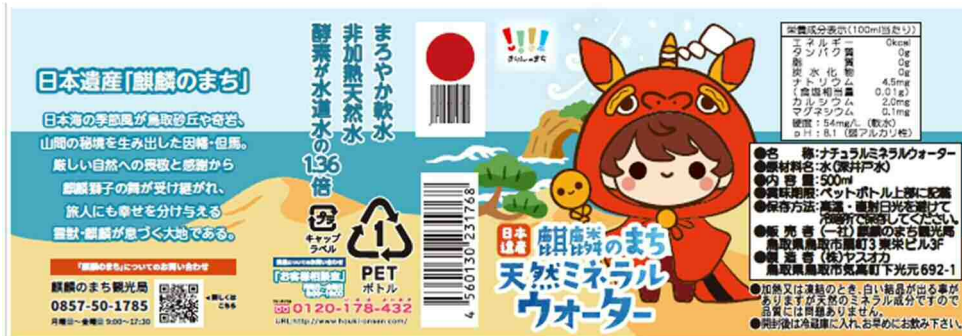
飲料水コラボラベル