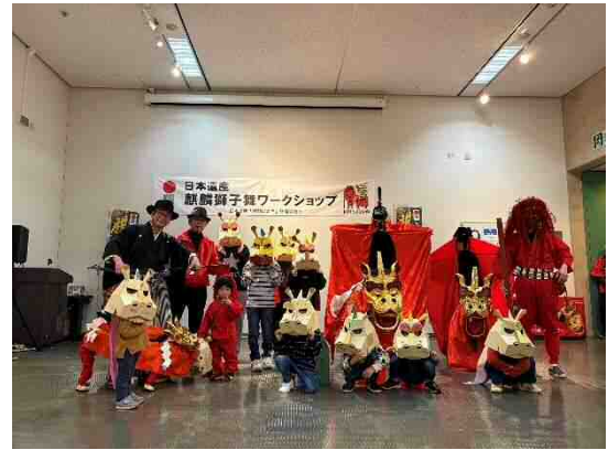
子ども向けワークショップ