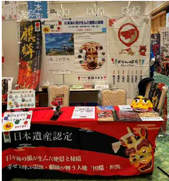
日本遺産フェスティバル in 倉敷