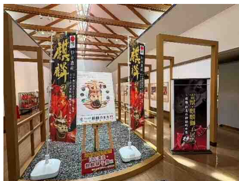
因幡万葉歴史館展示