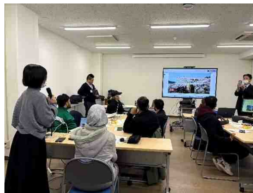
鳥取大学連携事業（留学生のツアー体験プログラム）