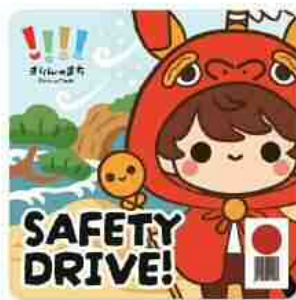
「きりんりん」デザイン