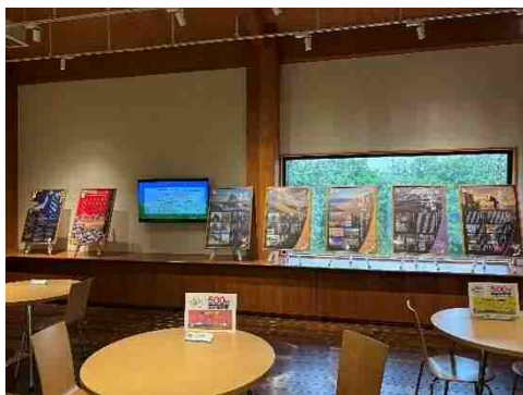
パネル巡回展（鳥取市）