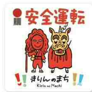
「麒麟獅子」デザイン