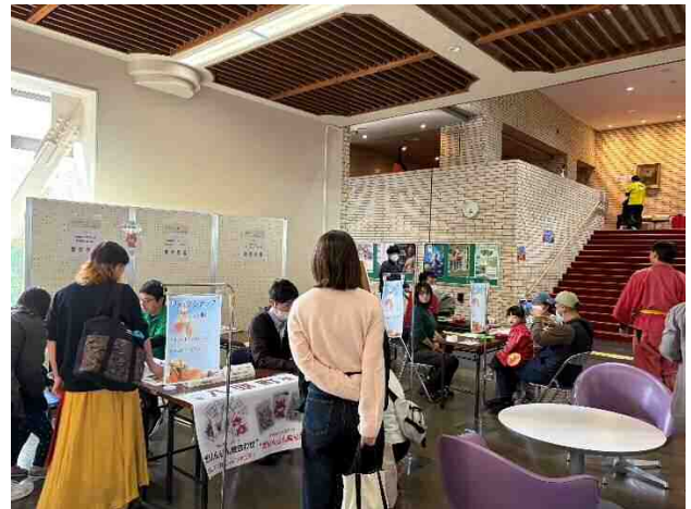
日本遺産・麒麟獅子舞フェスタ 2025