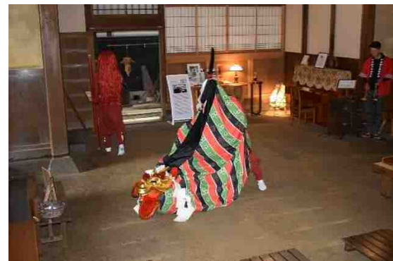
麒麟獅子舞体感イベント (新温泉町・智頭町)