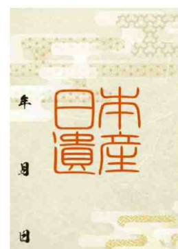
日本遺産 御周印帳（中面）