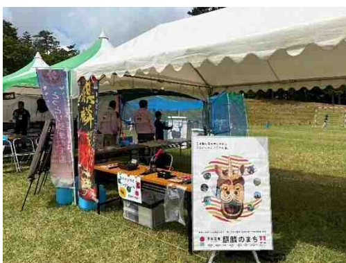
とっとり GOOD FOOD MARKET マルコラ