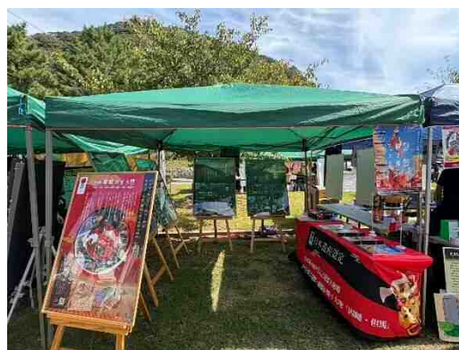
鳥取三十二万石お城まつり