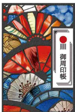
日本遺産 御周印帳（表紙）