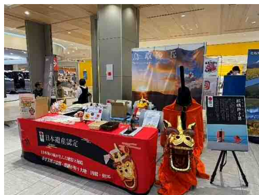
鳥取県観光 PR イベント（ららぽーと門真）