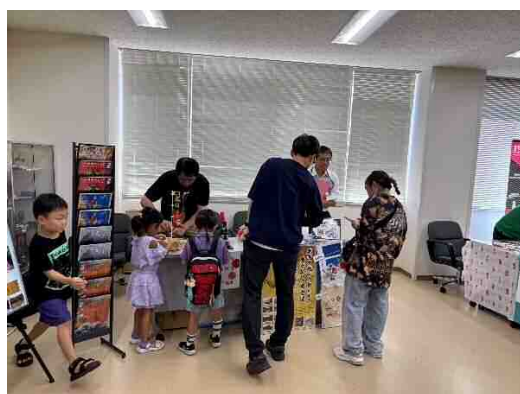
とっとり日本遺産フォーラム