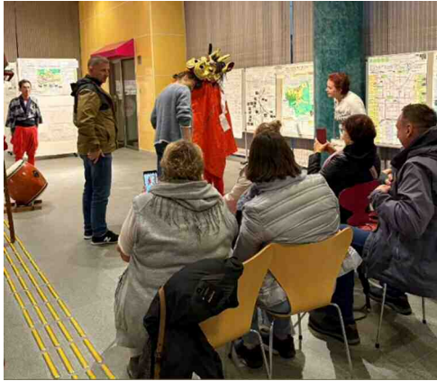
ヨーロッパからのツアー対応