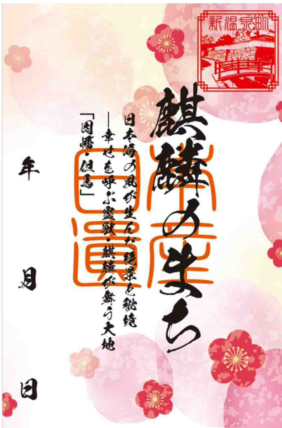
【新温泉町】新温泉町浜坂味原川地区