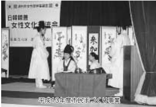
平成13年度市民手づくり事業

韓国から鳥取に来て早一年、鳥取の美しい自然や街なみ、そして親切な市民のみなさんに囲まれ、充実した一年を過ごすことができました。美しい桜の咲く春を迎え、