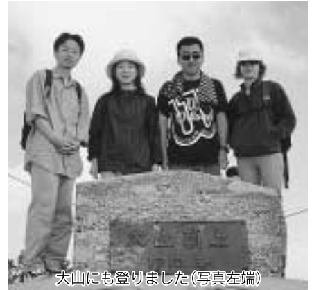
大山にも登りました(写真左端)