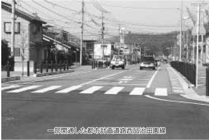
一部開通した都市計画道路西品治田園線