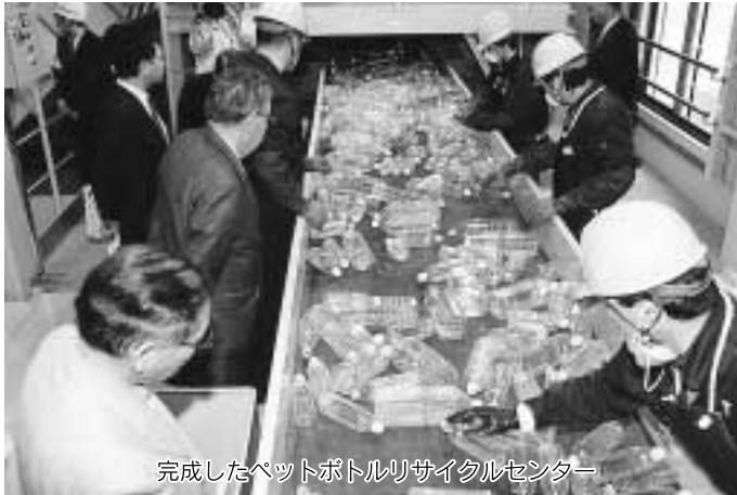
完成したペットボトルリサイクルセンター