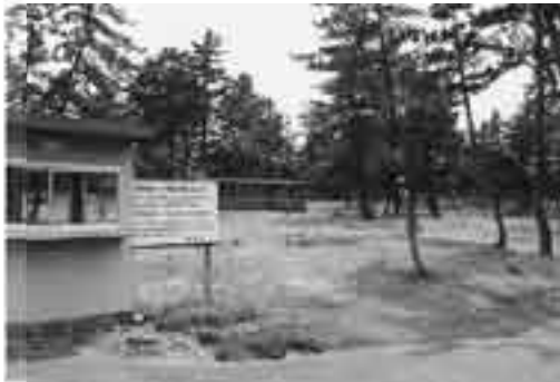
柳茶屋キャンプ場

この区域は、自然体験プログラムを実施することのできる拠点施設「自然体験館」を整備することとします。 この「自然体験館」は、鳥取砂丘の特徴を紹介するとともに、市民、県民が主役として砂丘を使った自然体験プログラムやイベントの実施などができる活動拠点施設です。