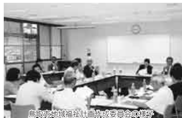
鳥取市地域福祉計画作成委員会の様子