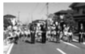
都市計画道路出合橋松並線開通

[主な事業] 民生費 保育事業費 34億5,727万円 生活保護費 20億8,400万円 重度障害者医療助成費 5億8,593万円 児童手当・児童扶養手当給付費 10億2,143万円 4歳未満児医療助成費 1億9,857万円