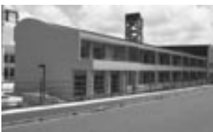
若葉台小学校校舎増築工事

[主な事業] 地区体育館新設事業費 1億2,748万円 小学校校舎増改築事業費 11億2,229万円 公民館整備事業費 1億3,692万円 小・中学校30人学級実施事業費 5,413万円 私立幼稚園運営助成費 1億6,412万円