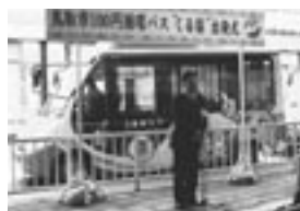
100円循環バス「くる梨」本格運行

[主な事業] 道路整備費 11億4,953万円 街路整備費 8億2,015万円 市営住宅建設・建替事業費 11億946万円 白兎海岸周辺整備費 1億390万円 河川整備費 1億1,009万円