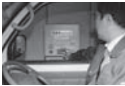
↓ ボタンを押し、駐車券を取ります