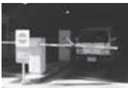
出口は、歩行者に気をつけて、ゆっくりお進みください。