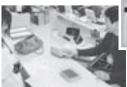
↓ 市役所、市関係施設を利用された場合は最長3時間無料となります