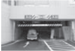
↓ 車高2.1mまでの自動車に限ります