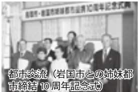
都市交流（岩国市との姉妹都市締結10周年記念式）