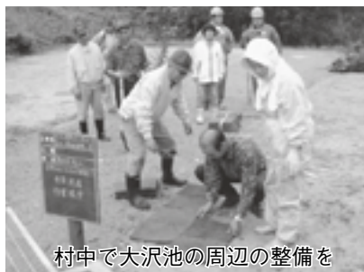
村中で大沢池の周辺の整備を

上野地区の貴重な資源の一 つに、四季折々 に表情を変える 大沢池がありま す。ここは、県 の鳥であるオシ ドリをはじめ、 カモなどの渡り 鳥が越冬する水 鳥たちの天国。 ここでも活性化