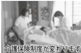
介護保険制度が変わります