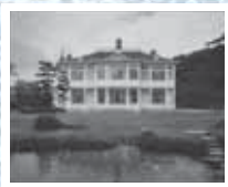
「初夏の仁風閣庭園」