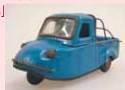
「プリキのオート三輪」