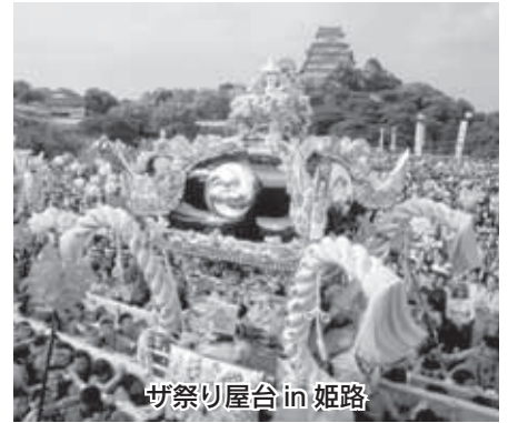
ガザ祭り屋台 in 姫路