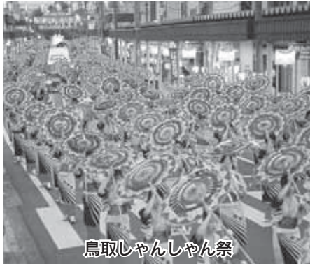
鳥取しゃんしゃん祭