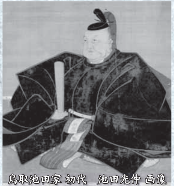
鳥取池田家初代 池田光仲 画像

3市の歴史的な結びつきは江戸時代にさかのぼり、池田家の国替えなど、家臣、商人など多くの人々の移動や交流が幅広く行われてきました。