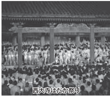
西大寺はたか祭り