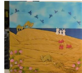
(折り紙教室の作品)