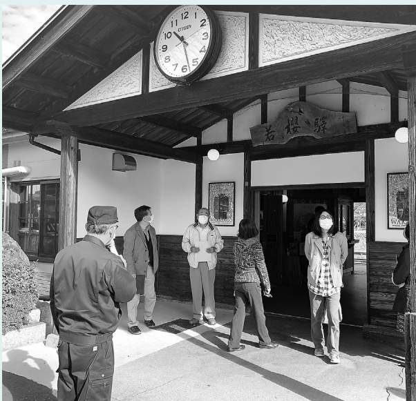
若桜駅視察の様子

若桜駅では若桜鉄道と若桜町の職員の方から説明を受け、その後、質疑応答を行いました。委員からは多くの質問があり、予定の時間を過ぎるほど活発に行われました。午後からは、隼駅と恋山形駅の外観を視察し、帰路に付きました。