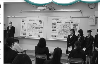
青谷学Ⅰ(発表の様子)