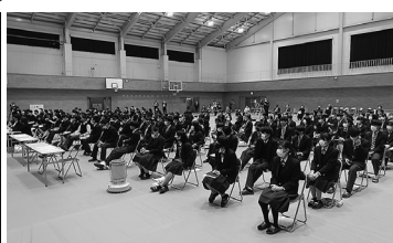
青谷学Ⅱ(会場の様子)