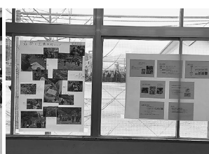
青谷学Ⅰ(ポスター展示)