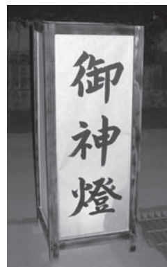
区民で作成した「御神燈」