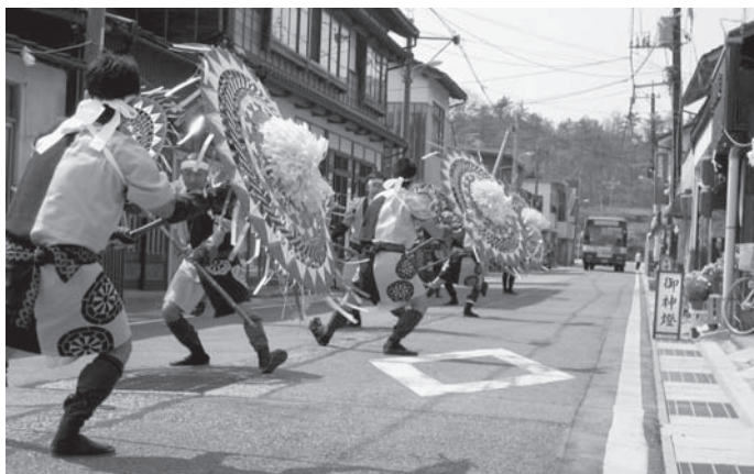
祭りに華を添えた「傘踊り」

また、祭り当日は「駅前傘踊り保存会」のみならず、人による勇壮な踊りが披露され、御神燈とあわせ祭りに華を添えました。