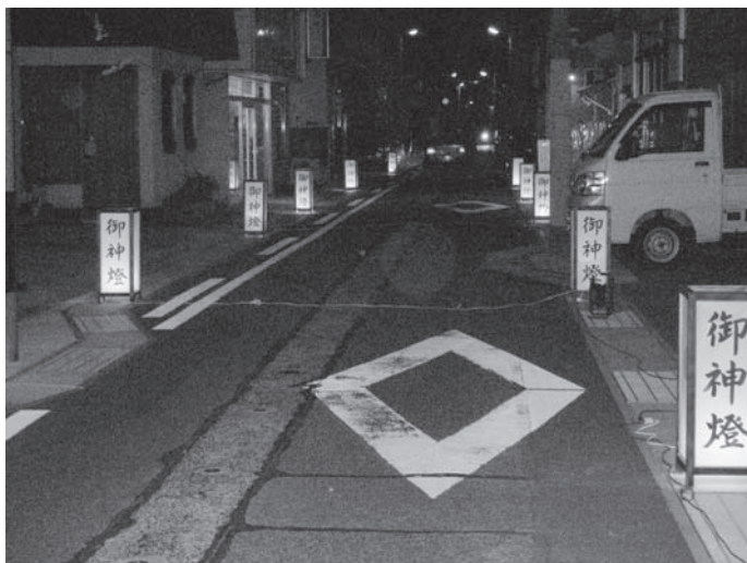
駅前区を照らす「御神燈」