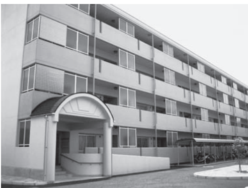
入居が始まった青谷あさひ団地

地域審議会に關すること は、青谷町総合支所 地域振興課(☎85・0011)へおたずねください。