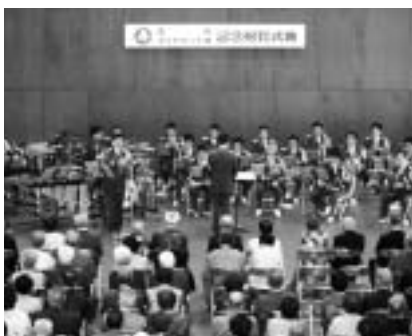
警察音楽隊によるアトラクション

式典の後、鳥取県警察音楽隊による「加山雄三メドレー」「美空ひばりメドレー」など、懐かしい曲の演奏を聞きながら、半世紀の間共に過ごしたことへの感謝と、健康で迎えられたことを喜び合いました。