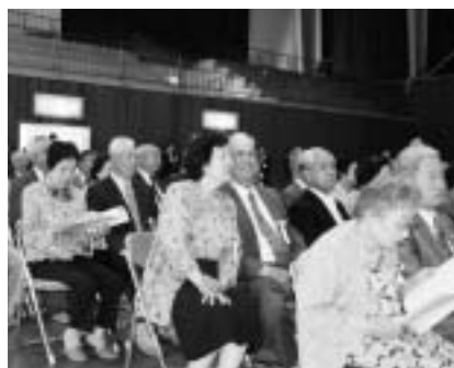
これからも助け合い、明るく元気で