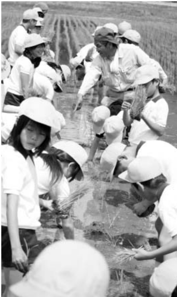
指導を受けながら苗を植える子どもたち