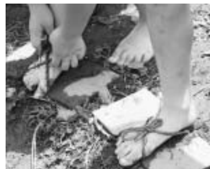
田下駄をはいて体験

体験実習では、まず青谷上寺地遺跡公園付近で弥生時代の田んぼが確認され、水路の溝や田下駄などが出土していると説明を聞きました。子どもたちは、出土品から再現した田下駄を履いて田んぼの中を歩いてみました。 そして田植体験では苗の植え方を習い、2班に分かれて田んぼに入りました。中央に向い合い横一列に並び、慣れない田んぼでこけそうになったり、田んぼの感触を楽しみながら手