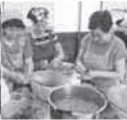
第4回びわの加工講座