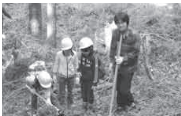
植林のため穴を掘る子どもたち