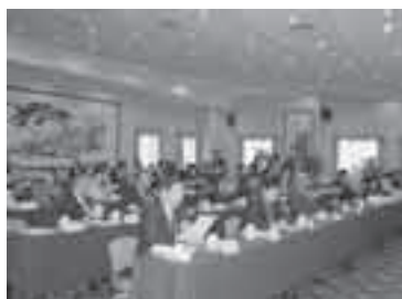
式典には 多くの人が参加