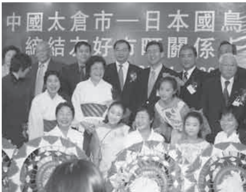
芸能公演を終えての記念撮影