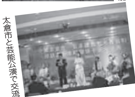
太倉市と芸能公演で交流