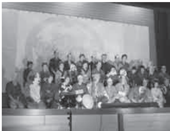
5年に一度の大事業…力が入ります(日置谷地区)

竹太鼓、国府町から傘おどり保存会、河原町から散岐皿回し健康づくり同好会、佐治町から佐治民話会、気高町から逢鷲