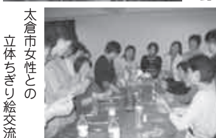
太倉市女性との 立体ちぎり絵交流