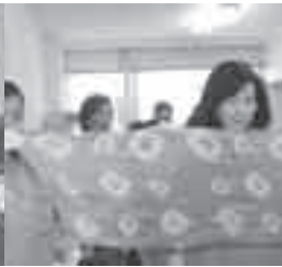
第2回草木染め講座