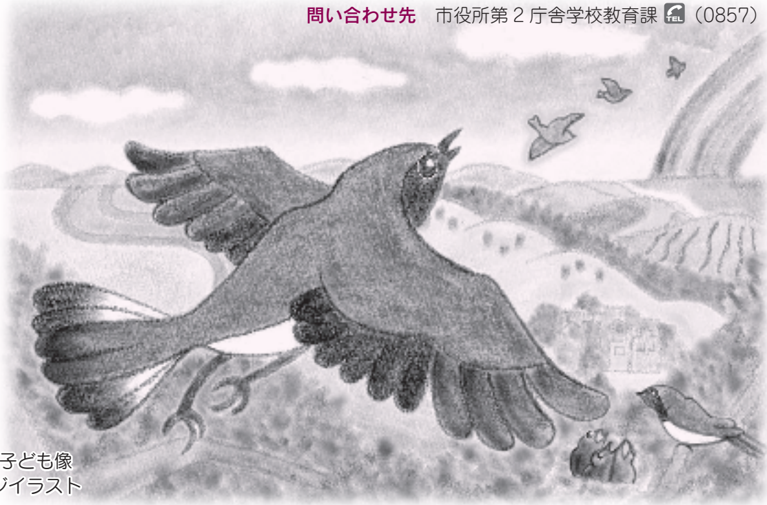
めざす子ども像 イメージイラスト

鳥取市の未来を担う人づくりのために、鳥取市の教育の進むべき方向を示す、「鳥取市教育ビジョン」「めざす子ども像」を策定しました。今後、「鳥取市教育振興基本計画（仮称）」の策定にとりかかります。