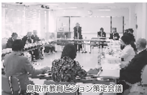
鳥取市教育ビジョン策定会議

「ふるさとを思う子」とは、地域で多様な人との関わりをとおして生きていく力を身につけ、自分の根ざした場所を大事にする子、将来ふるさとを支えているような子をイメージしています。「志をもつ子」とは、夢や希望を持ち、理想とする生き