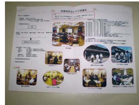
第1号 まちづくり協議会だより