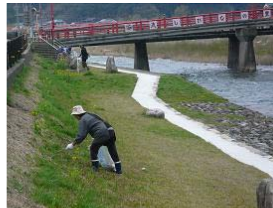
クリーンもちがせ清掃活動