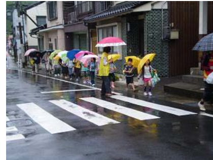
防犯ボランティアの活動