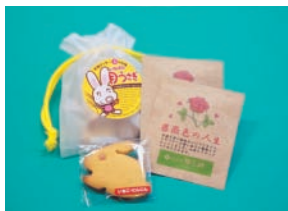
いなばの月うさぎ(クッキー)1袋、 薔薇色の人生(ティーパック)2つ

「とっとり市報」へのご意見、ご感想をお寄せください。 抽選で5名様にプレゼントします。